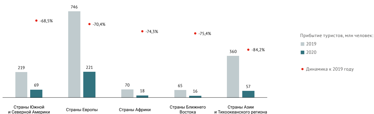
Рисунок 2. Изменение туристических потоков в мире в зависимости от направления в 2020 году